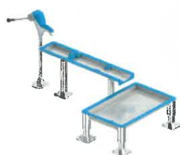
Rijn / Rhine 570.101.010.xxy

Certificaat nr. - certificate number : Z-PL-21-04-5010394765-001-736401071-04-01 Dossier nr. - file number: 736401071-04-01 Betreft - Subject to: Aqua Mud Factory